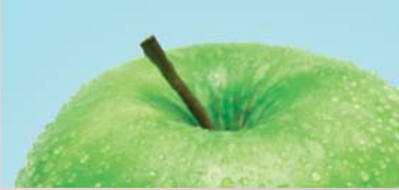
Healthy Eating Alimentation saine