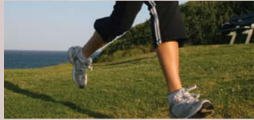
Physical Activity Activité physique