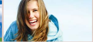
Psychological Wellness Mieux-être psychologique