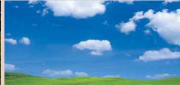
Tobacco-Free Living Réduction du tabagisme